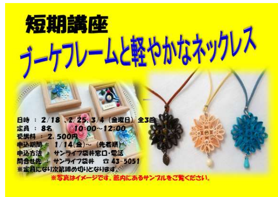
ブーケフレームと軽やかなネックレス