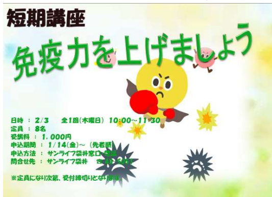
免疫力を上げましょう